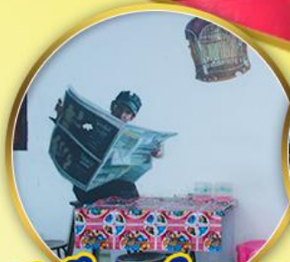
สตรีทอาร์ตเบตง