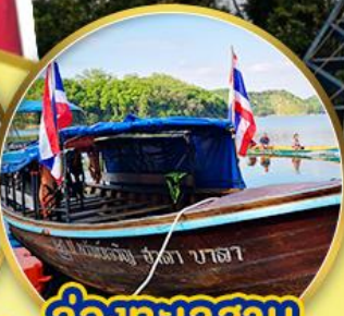
ล่องทะเลสาบ ฮาลาบาลา